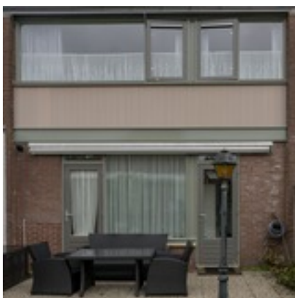
De achterzijde van de woning