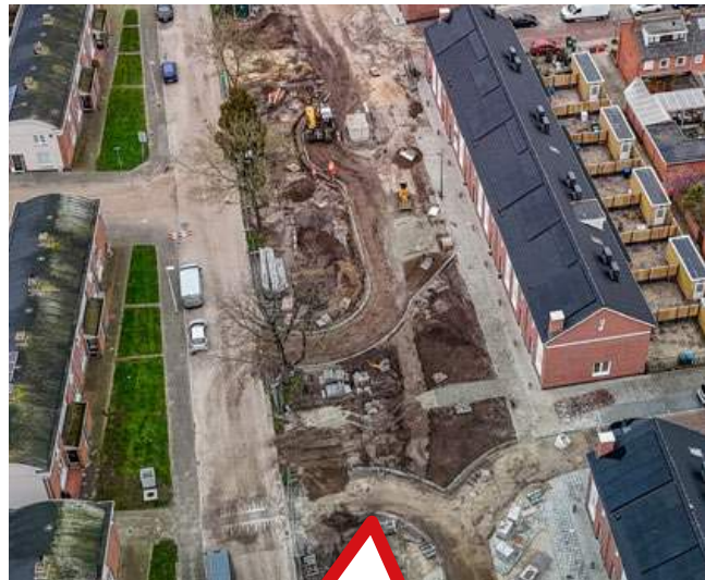
De Populierlaan vanuit de lucht

de beurt. Deze werkzaamheden duren tot aan de kerst. Begin 2025 volgt dan nog het stukje van Teunisbloemstraat tot aan de rotonde met de Rooseveltlaan. En dan is weer een stuk Gageldonk-West af!